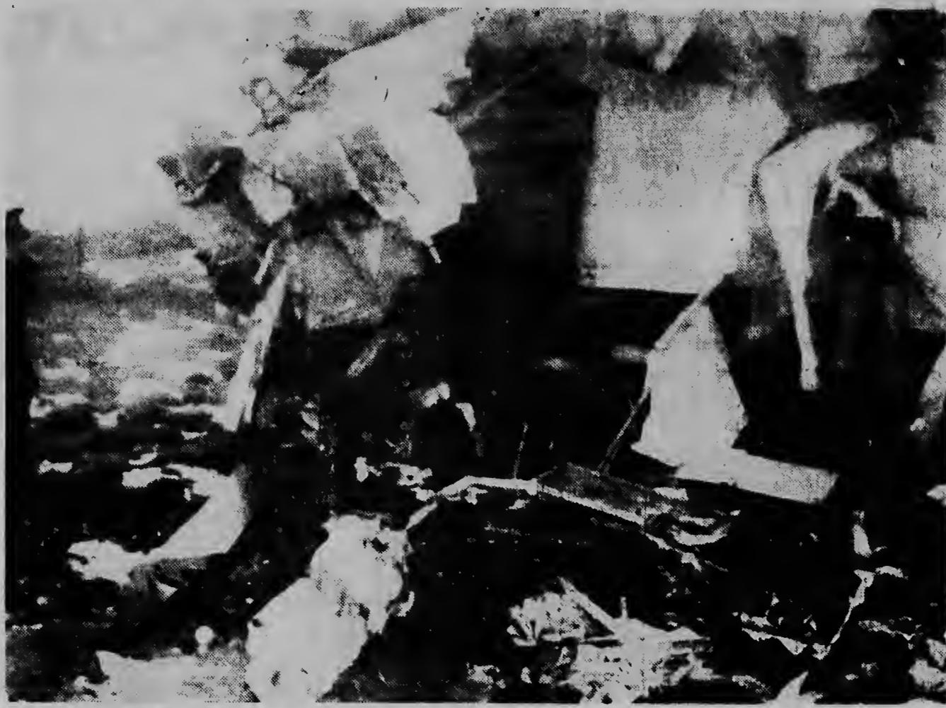
Donderdag 27 februari is een vliegtuig van de Britse luchtvaartmaatschappij „Silver City“ in de heuvels nabij Bolton (in het Engelse graafschap Lancashire) ontaald gestort. Er zijn zeker 30 doden te betreuren en een aantal gewonden.